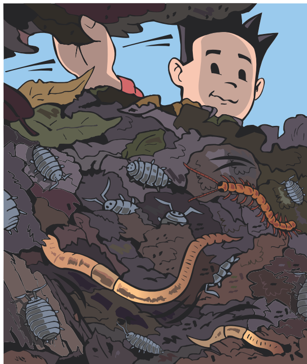
Un signe que votre compost se porte bien : il héberge de nombreux habitants tels que cloportes, vers de terre, myriapodes...

À l'instar de ce qui se passe dans la nature dans les litières forestières ou de prairies, le compostage à domicile se fait le plus souvent sans élévation de température . En effet, si les réactions de dégradation des matières en présence d'oxygène produisent bien de la chaleur, celle-ci s'échappe facilement, contrairement à ce qui se passe dans les andains du compostage industriel où la chaleur s'accumule, provoquant une montée de température dans la masse des déchets en compostage.